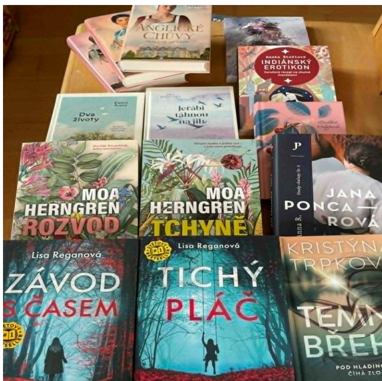
Výběr z novinek