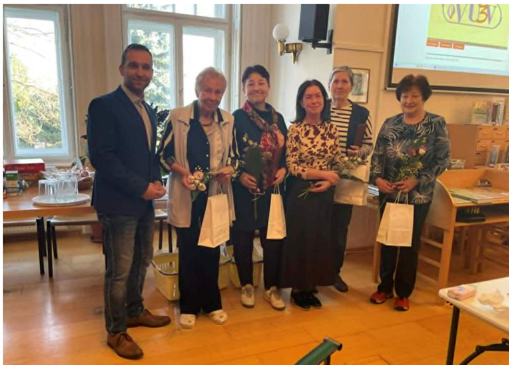
Absolventky VU3V, pan starosta, knihovnice