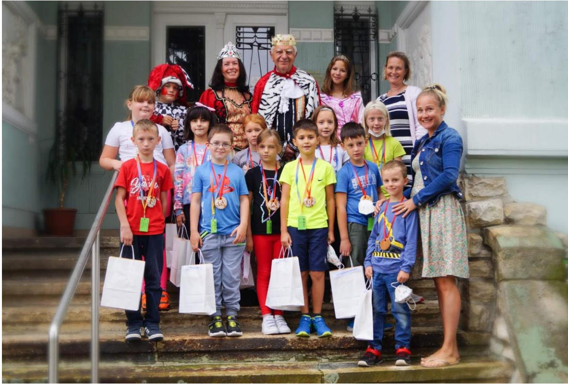
RYTÍŘI DRUHÉ TŘÍDY