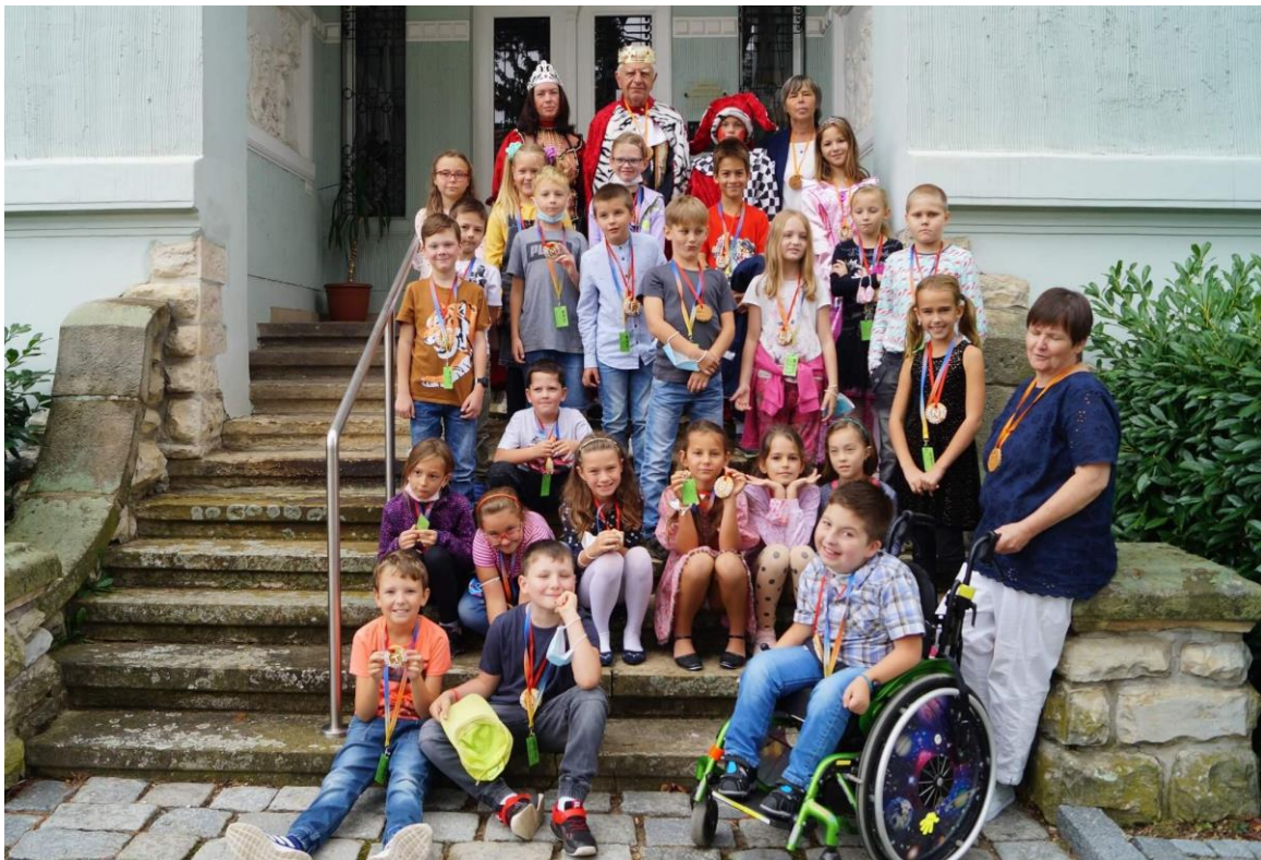
RYTÍŘI TŘETÍ TŘÍDY