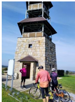
Na trati – Vojtěchovská rozhledna

Letošní sezónu jsme zakončili v sobotu 27. listopadu 2021 jako každoročně Zamykáním kol. Přes noc sice chumelilo a mrzlo, ale přes den vládlo poměrně slunečné, i když chladné počasí. Vyrazili jsme tedy na vyjíždku do okolí Horního Jelení. Po návratu do Platěnic a pozdním obědu jsme společně zavzpomínali na akci Z Moravan do Moravan, které proběhla před více jak dvaceti lety (2. 7. 1997 až 20. 8. 1999). Za připravenou prezentaci patří dík Ottovi Nečesanému a Petru Hlavatému. Poté jsme v uvolněné atmosféře začali pomalu plánovat akce na příští rok. Všechny akce můžete sledovat v nástěnce i na webu spoluhráci.cz .