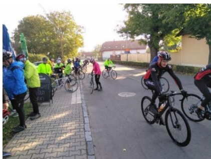
Momentka ze startu

V sobotu 2. října 2021 se uskutečnil jubilejní ročník Podzimního scyklování. Akce začínala prezentací v restauraci v Platěnicích a na start se dostavilo téměř padesát cyklistů. Za velmi dobrého, i když větrného počasí naše cesta vedla jako obvykle na pomezí Železných hor a Vysočiny, tentokrát do okolí Hlinska. Po ujetí poctivých 90 km v kopcovitém terénu, byla akce zakončena v Platěnicích.