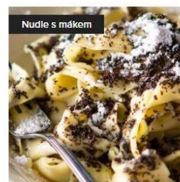
Dětské nudle s mákem, cukrem a máslem 75,00 Kč

Vaříme od pondělí do soboty - otevřené okénko je od 10:30 – 12:30 hodin.