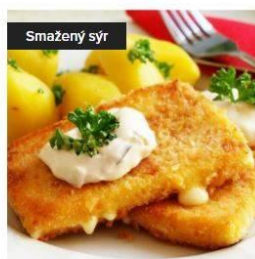
Smažený sýr s bramborami a tatarská 135,00 Kč