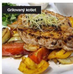
Grilovaný kotlet pečené grenaile 150,00 Kč