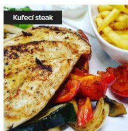
Kuřecí steak na grilovaných paprikách 150,00 Kč