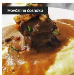
Hovězí kostky na česneku s bramborovou kaší 130,00 Kč