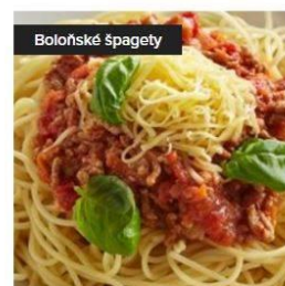
Boloňské špagety se sýrem Eidam 130,00 Kč