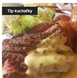
Roastbeef se zeleninou na másle a grenaile 150,00 Kč

Takže pokud se někomu nebude chtít vařit a chce využít našich služeb, poskytujeme Vám návod, jak si u nás jídlo vlastně objednat.