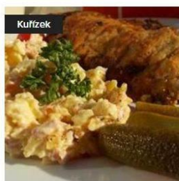
Kuřecí řízek s bramborem maštěným máslem 130,00 Kč