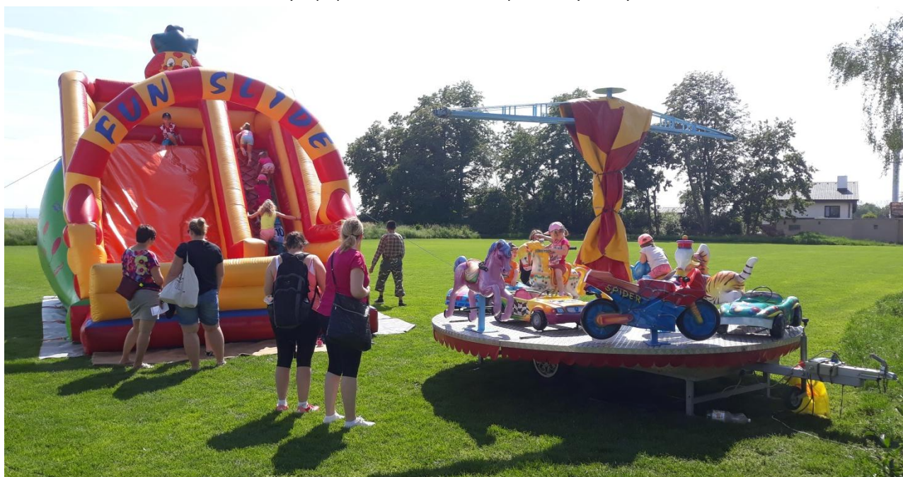
A oblíbené dětské atrakce skluzavka a kolotoč řetízák