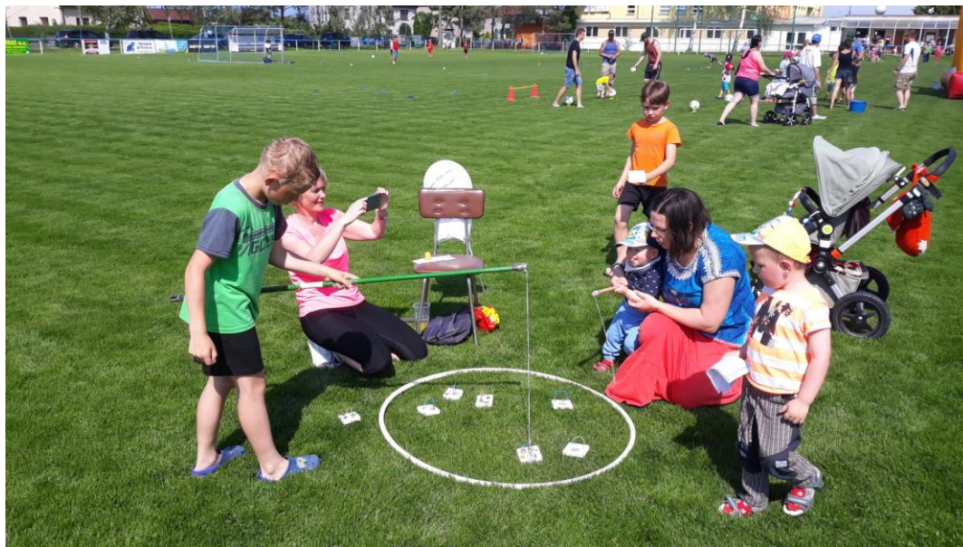
Pro děti byla připravena oblíbená disciplína „Chytání rybek“.

Pro děti byla jako každý rok připravena řada soutěží (střelba ze vzduchovky, skákání v pytli, překážková dráha, házení na klauna, petang, trojskok z místa, chytání rybek, židličkovaná a další), spousta atrakcí (skákací hrad, skluzavka, kolotoč řetízák, dětské líčení), bohatá tombola, jak pro děti, tak i pro dospělé, spousta sladkostí a cen a samozřejmě nechybělo tradiční opékání špekáčků.