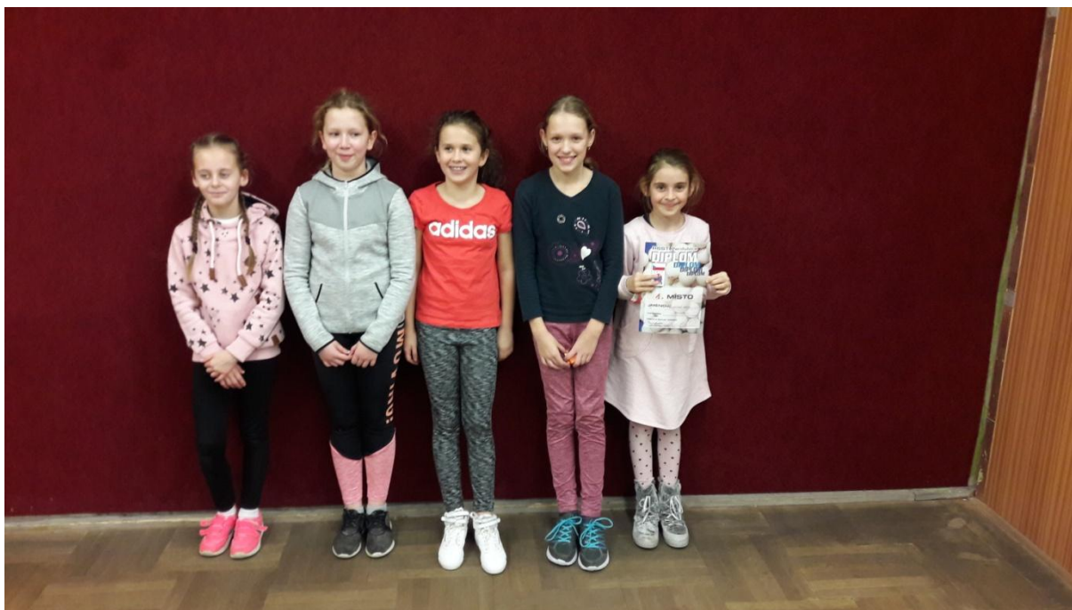
Foto: Děvčata po turnaji