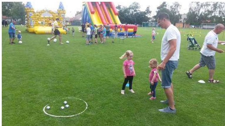
Soutěžící děti s rodiči v plném proudu

dospělé, spousta sladkostí a cen a samozřejmě nechybělo tradiční opékání špekáčků. Pro dospělé byla navíc připravena soutěž ve střelbě fotbalovým míčem na přesnost o 30 litrový sud piva a petang o lahve vína.