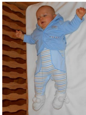
Vít Jiří Červený