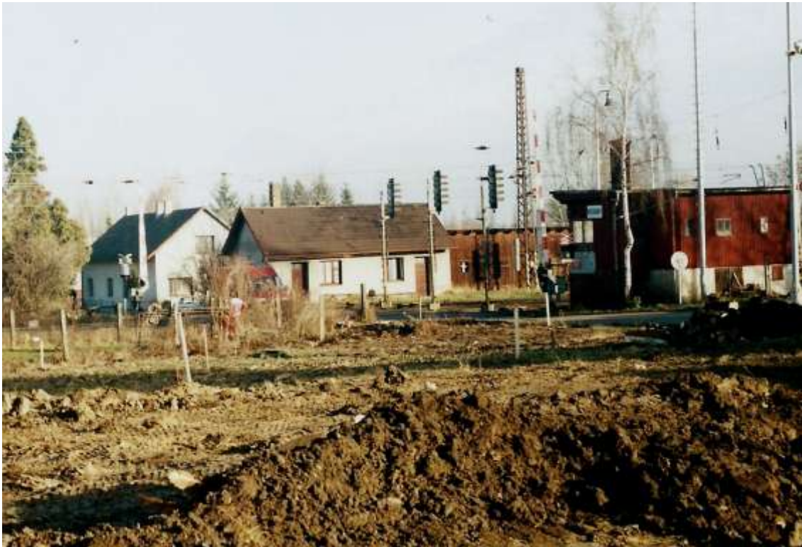
Původní železniční přejezd a jeho okolí, příprava staveniště - 11. 12. 1999

Víte, že už uplynulo 15 let od zahájení výstavby nadjezdu v Moravanech?