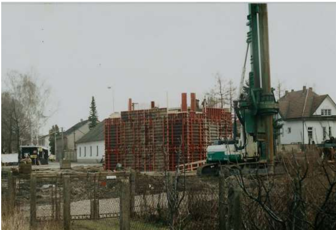
Betonování pilířů – 22. 2. 2000