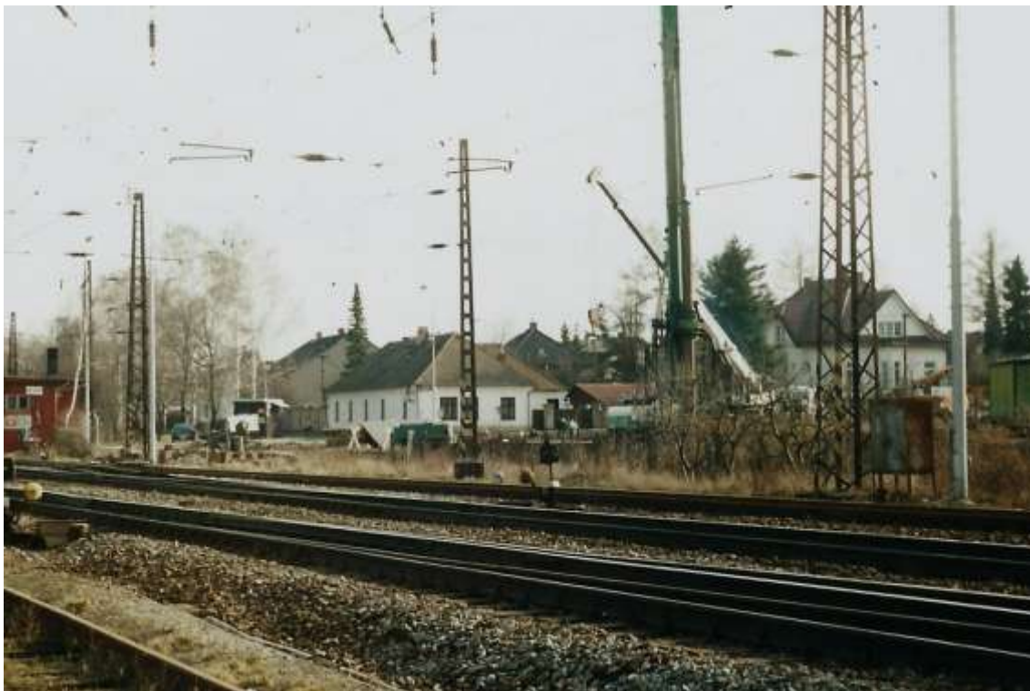
Betonování základů pilířů na jižní straně trati – 12. 1. 2000

Základy pro násep silnice od Platěnic, v pozadí sokolovna – 6. 1. 2000