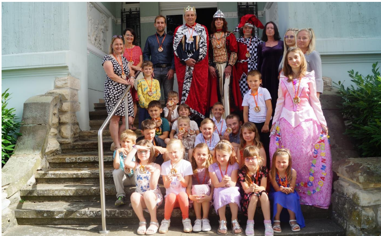
NOVÍ RYTÍŘI ČTENÁŘSKÉHO ŘÁDU