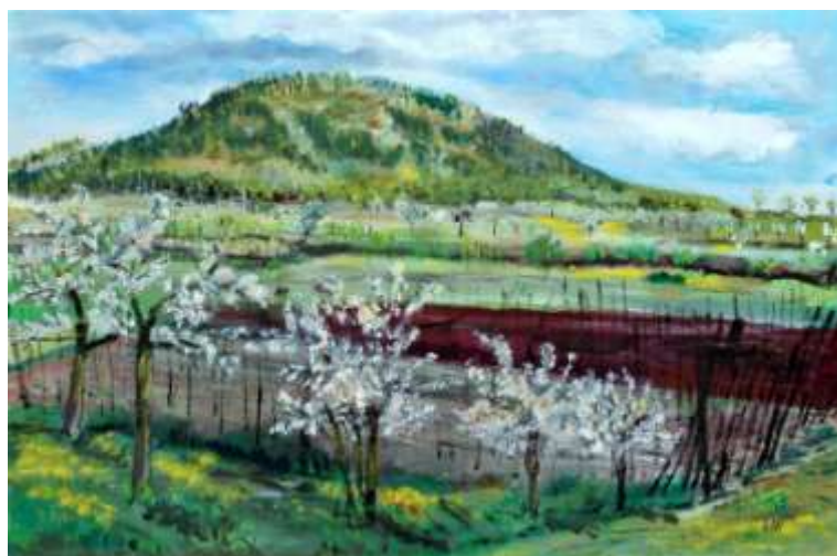
Jarní hora Říp