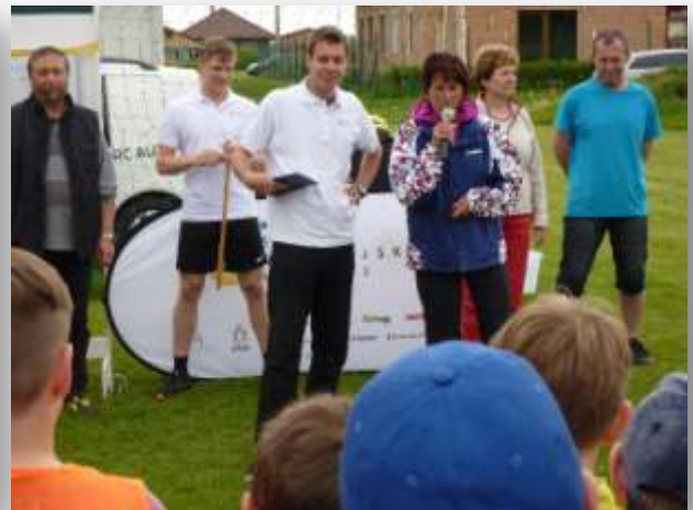
Mc Donald's Cup - okresní kolo Moravany