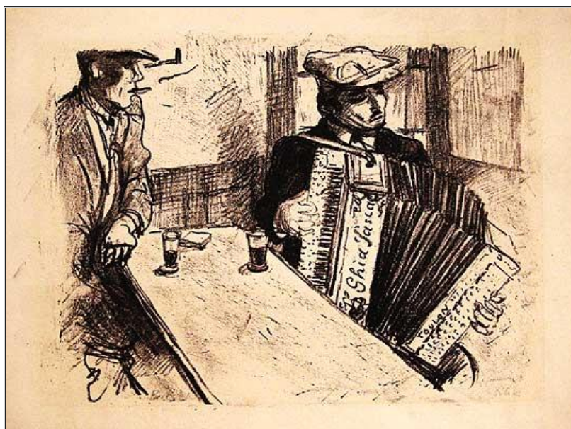
kresba: Emil Orlik