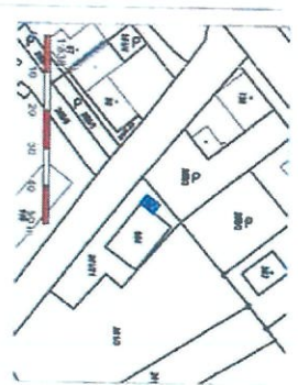
Jiná stavba p. č. st. 168